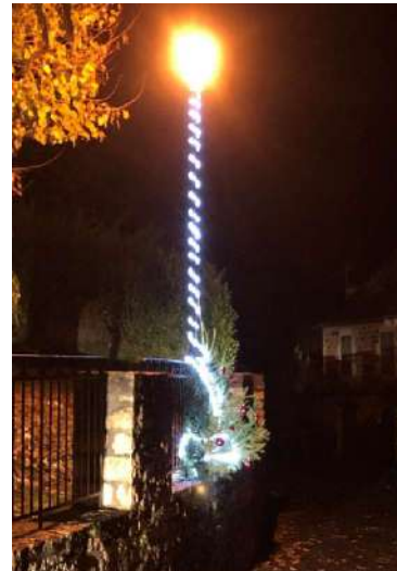
Décorations de Noël dans le Bourg