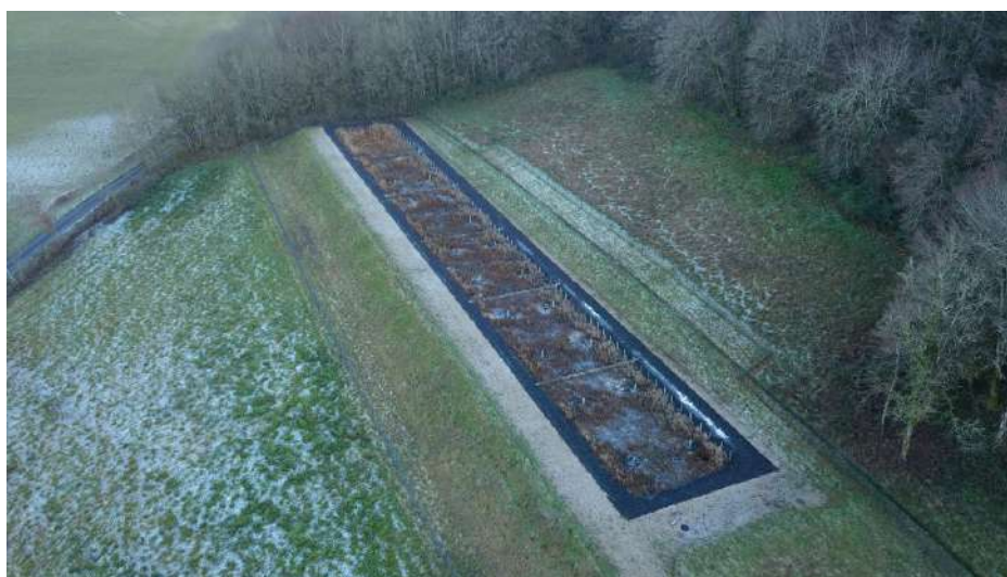
La nouvelle station d'épuration

SYNDICAT INTERCOMMUNAL D'ASSAINISSEMENT COLLECTIF DE LA TOURMENTE