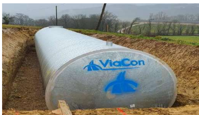
Citerne de Sangou