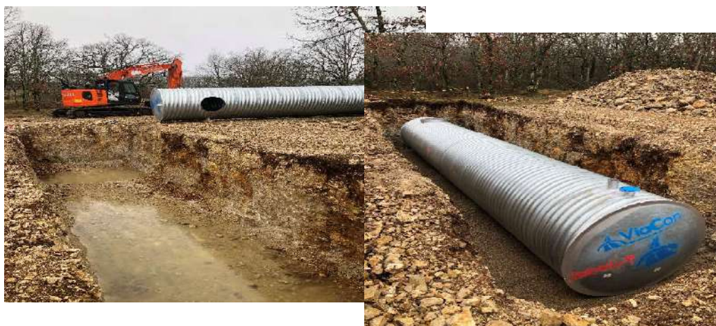
Citerne de la Bouygarélès

Les tranches 2 et 3 seront réalisées au cours de l'année 2022.