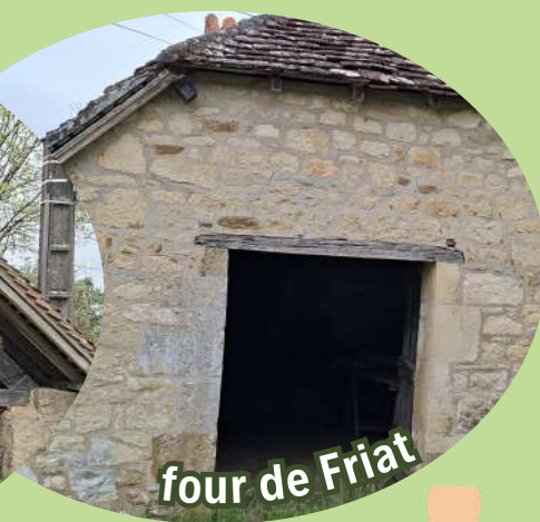
four de Friat