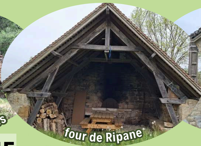
four de Ripane